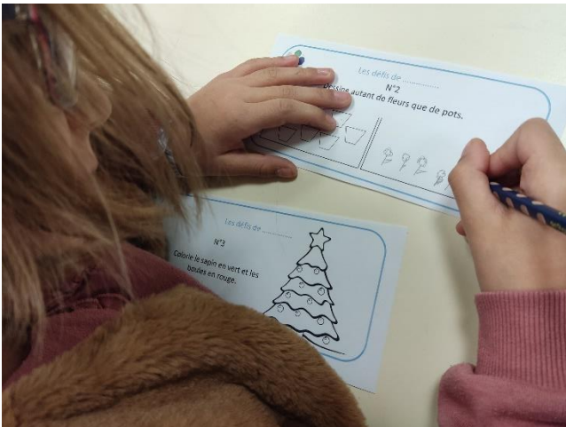
Défi proposé aux élèves de CE 1

Tous les matins, Mme Louchart, coordinatrice de l'ULIS, et Rosella, l'AESH leur proposent des défis qu'ils doivent résoudre. Ces énigmes sont adaptées. Le dispositif ULIS accueille des élèves de 7 à 11 ans. Il faut donc proposer des défis différents selon le niveau de chacun.